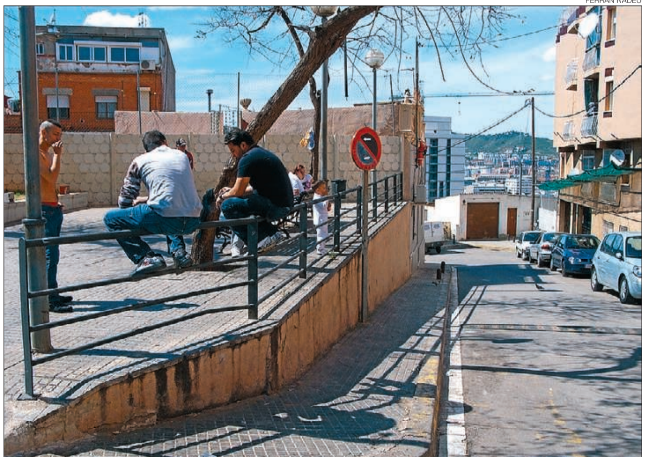
► Un grup de joves passa el dia en una plaça situada al costat del carrer d'Ernest.