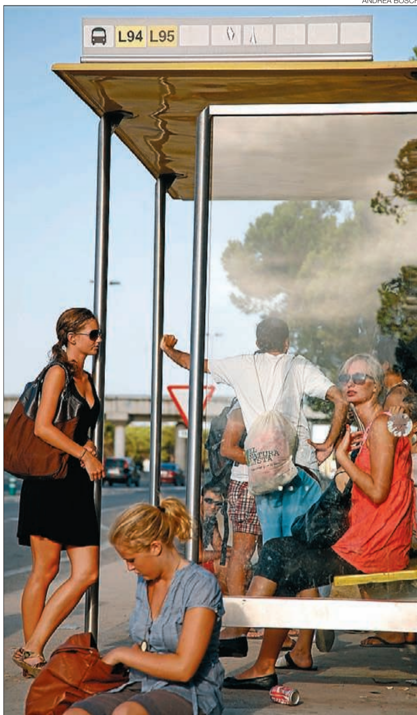
►► Sol i platja ► Algunes turistes esperen el bus Castelldefels-Barcelona.

A Turisme de Barcelona destaquen la mina que el FC Barcelona representa a nivell turístic. Cada setmana amb partit a casa l'equip exerceix de reclam per a escapades coronades amb bon futbol. «Ibrahimovic ha fet que la presència de suecs sigui molt més elevada», assenyalen fonts del consorci, tenint