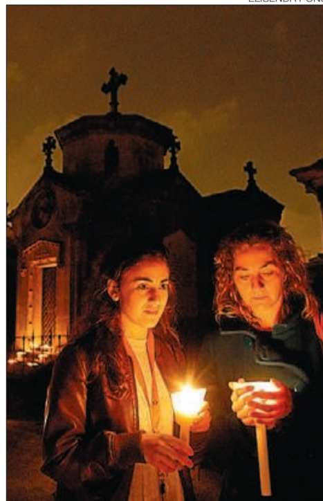
► Dues participants en la visita nocturna.

tombes al voltant per poder acollir els centenars de missatges, exvots i flors que deixen tots els seus admiradors.