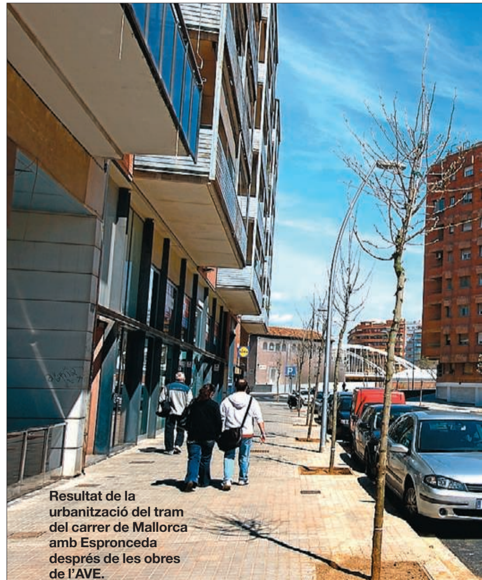
Resultat de la urbanització del tram del carrer de Mallorca amb Espronceda després de les obres de l'AVE.

ses de l'Eixample. Cinc andanes seran per a l'AVE i n'hi haurà quatre per a Rodalies.