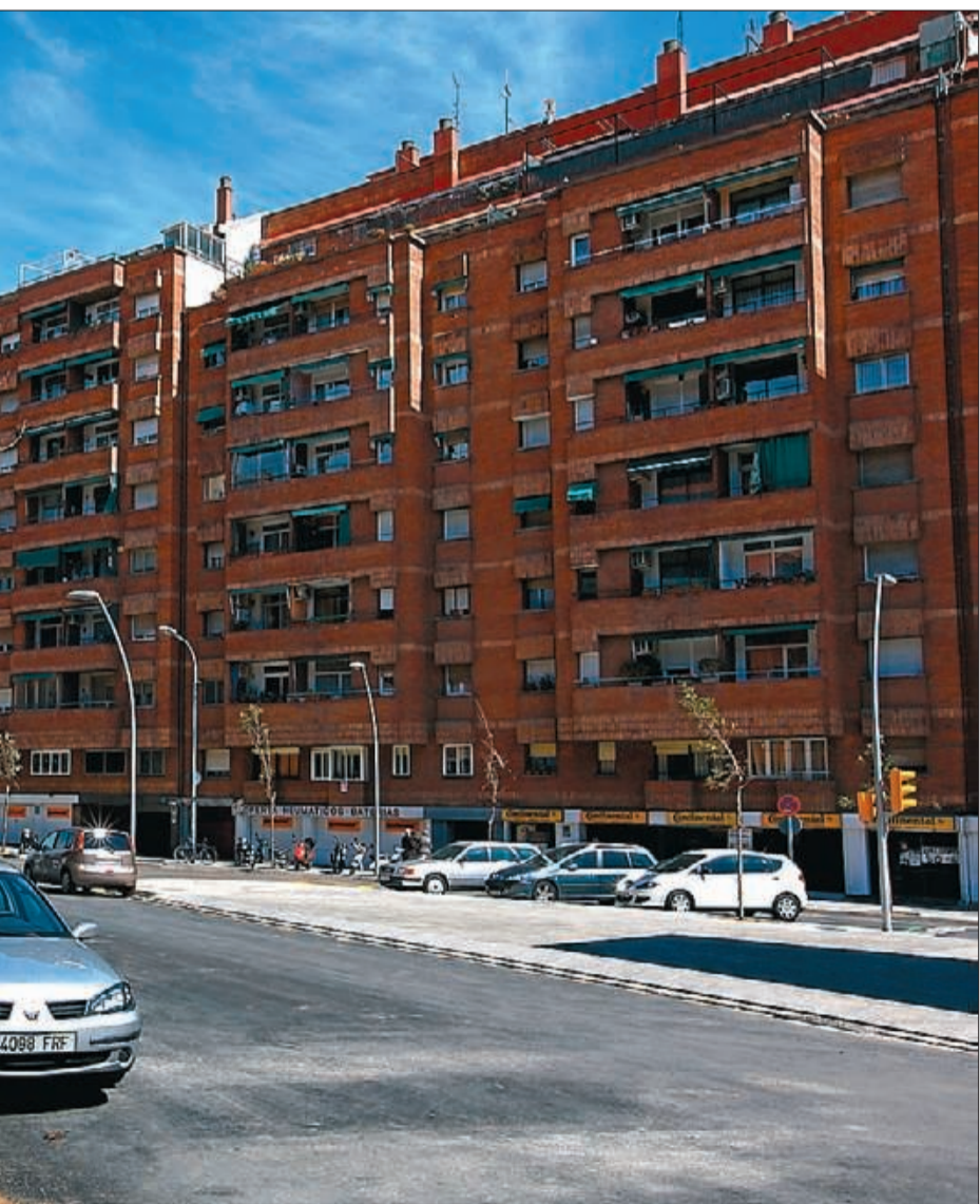
Les obres i el pou del carrer de Biscaia amb Mallorca, on va iniciar els treballs la tuneladora.

rà a Rodalies, al metro i a l'aparcament. Està previst que l'estació entri en funcionament el 2016 i es calcula que arribarà a acollir uns 100 milions de passatgers a l'any.