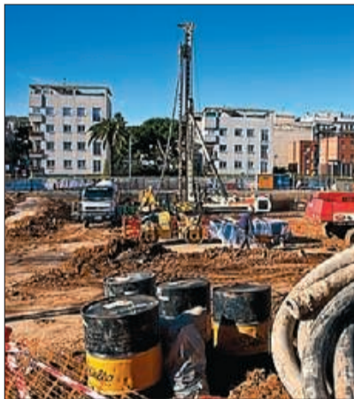
► Estat actual de les obres.

La remodelació –que té un pressupost que puja fins als 18 milions d'euros– es va iniciar just després de l'estiu i està previst que s'allargui fins al 2014. L'objectiu no és solament millorar les instal·lacions, sinó també recuperar gran part dels 2.000 socis que han anat abandonant l'entitat durant els últims anys. Les obres es portaran a terme en dues fases. La primera és la més