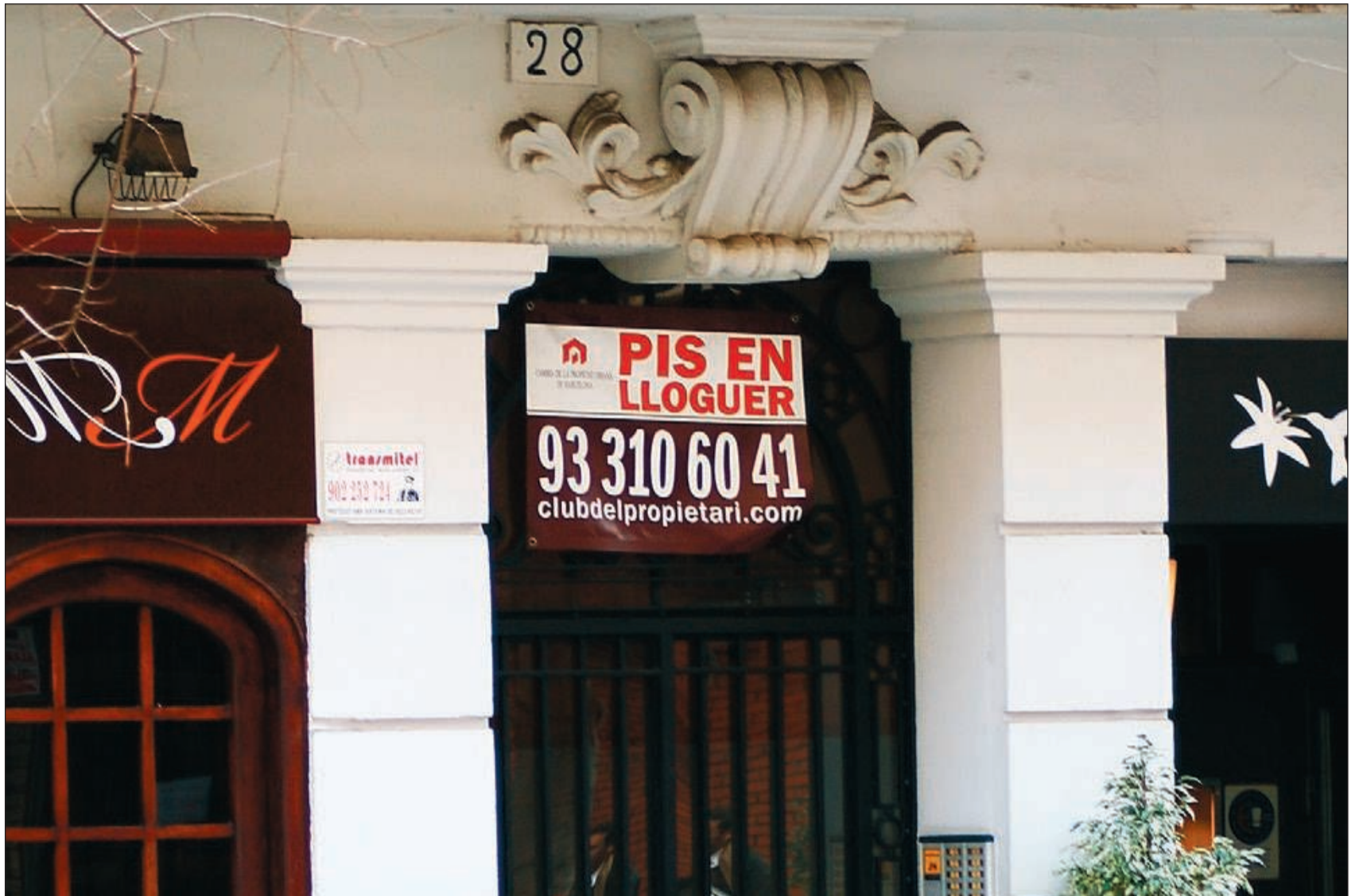
Vivenda de lloguer a l'Esquerra de l'Eixample de Barcelona.

→ Que la renda mensual no superi els 1.500 euros a la ciutat de Barcelona; els 1.200 euros a la resta de municipis de la zona A; els 1.000 euros a la zona B; els 800 euros a la zona C i els 600 euros a la zona D. Els municipis que conté cada zona es poden consultar a la pàgina web de la Conselleria de Medi Ambient i Habitatge ( http://mediambient.gencat.cat ). → No haver exigut una fiança superior a dues mensualitats de renda, ni cap altra garantia addicional per a la firma del con-