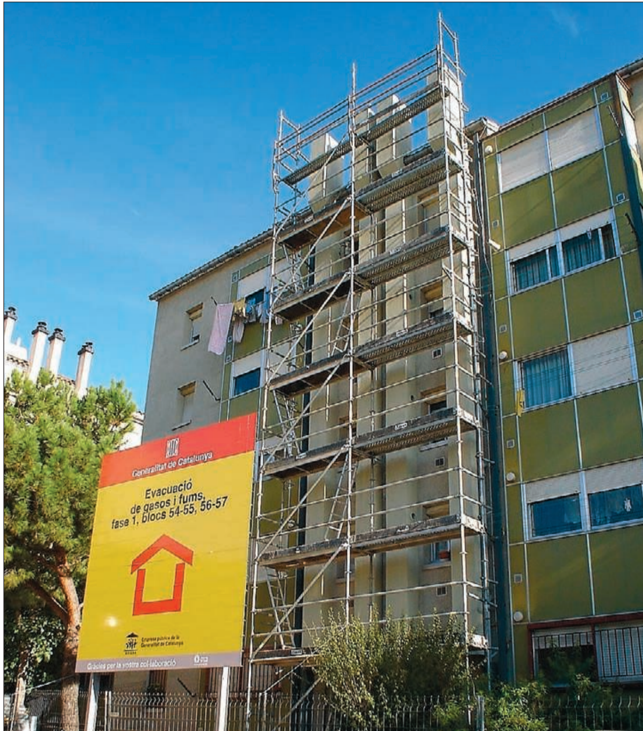
Obres de rehabilitació finançades per la Generalitat en un bloc de vivendes del barri d'Arraona, a Sabadell.

A nivell general, el dictamen del tècnic podrà tenir diferents graus en funció del tipus, la gravetat i la generalització de les possibles lesions detectades. Molt greu, si afecten greument l'estabilitat de l'edifici i representen un perill per a la seguretat de les persones, o greu, quan existeixin lesions que han de ser arreglades en el termini indicat. El responsable de la ITE també pot determinar que l'edifici presenta deficiències lleus produïdes per