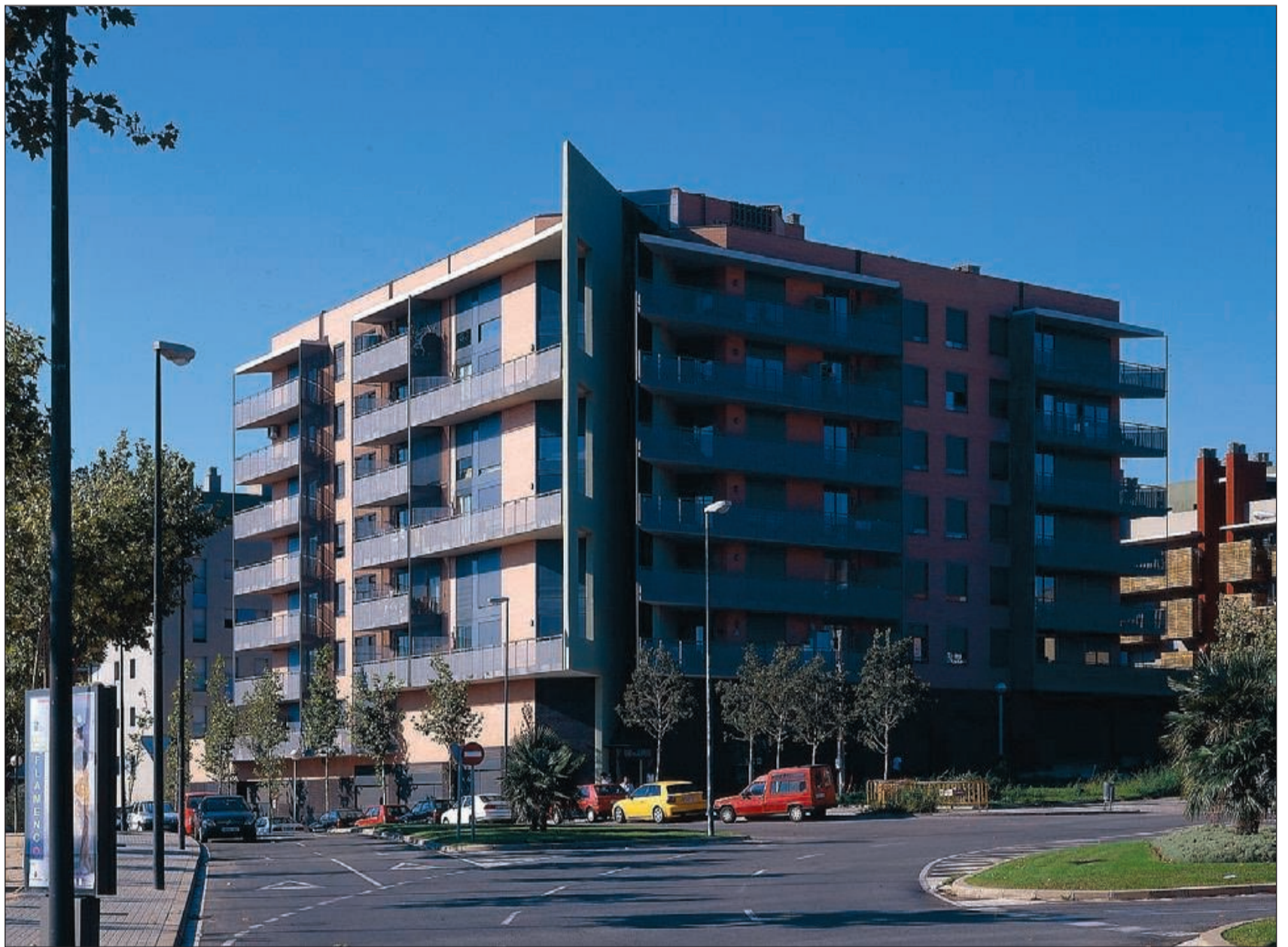
Promoció de vivendes al carrer Molí de la Torre de Badalona.