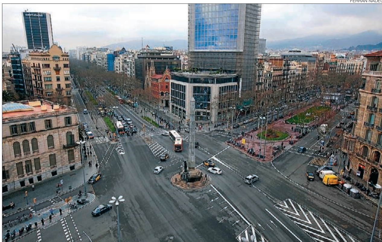
► Imatge del Cinc d'Oros, amb l'obelisc, des de dalt d'una finca d'un xamfrà del passeig de Gràcia, dimarts.

FALSA RAMBLA // Dit d'una altra manera, la que es proposa com a opció B no és res més que una falsa rambla i, per tant, la col·locació de fites pel mig no interromp cap circulació natural. Feta aquesta puntualització, s'ha de reconèixer que la cruïlla de l'avinguda Diagonal amb el passeig de Gràcia i el de Sant Joan són, sens dubte, dos dels punts més difícils de resoldre en un projecte de transformació. Sobre-