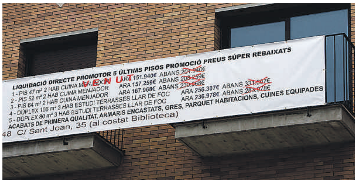
El crédito hipotecario, en el ojo del huracán del sistema financiero

Y es que el volumen total de inversión crediticia, como no cesan de repetir los empresarios y las fuerzas políticas, no para de caer. Desde el último trimestre del 2008, cuando los préstamos rozaron los 1,87 billones de euros, el volumen total del crédito ha descendido en cada uno de los trimestres posteriores. A finales del