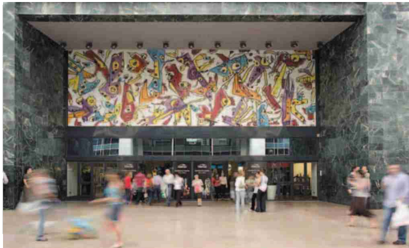
Entrada del centro comercial Gran Casa, en el barrio de Actur, convertido en zona comercial y de oficinas

El sitio de los franceses destruyó buena parte del antiguo centro histórico. La ciudad era demasiado pobre para afrontar la reconstrucción, de manera que se acabaron derruyendo los edificios y los templos que habían sido malheridos por la artillería de Napoleón. De ahí ese aire que usted detecta. Pero el sitio de Zaragoza fue uno de los sucesos más románticos que se registraron en el siglo XIX. Tuvo