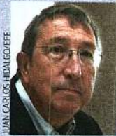
JUAN NAVARRO BALDEWEG

■ Juan Navarro Baldeweg (a la derecha). Autor del Centro para las Artes Escénicas de la Comunidad de Madrid, el Museo de las Cuevas de Altamira y el Palacio de la Música y de las Artes Escénicas en Vitoria, entre otras obras.