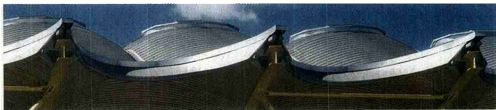
CUBIERTA DE LA T4 DE BARAJAS DE LAMELA Y ROGERS: UNA OBRA CIVIL PROPIEDAD DE MADRID

tan las obras de arquitectos españoles. Conforme a la ley española, las directivas europeas y el Convenio de Berna, el arquitecto y sus herederos pueden ostentar propiedad intelectual sobre los proyectos, las maquetas y la obra terminada. Además, existe un derecho irrenunciable del creador que es el derecho moral sobre su obra. Existe un gran desconocimiento social y profesional sobre el derecho de los creadores de obras de arquitectura. Y entre los titulares de los edificios públicos, existe la conciencia de que por el hecho de poseer estos inmuebles, está implícito el derecho de transformarlos.