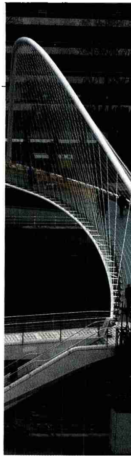
PUENTE DE CALATRAVA (BILBAO)

Dice el arquitecto Eduardo Arroyo que "hay una delgada línea que separa la copia de la interpretación, la creatividad de la creación y la originalidad del origen. De manera extraña, una vez acabado el proceso de su gestación cuando ya empiezan a relacionarse con el entorno, dejan de emocionar a su creador, de transformarle, despegados ya del proceso de intercambio de descubrimientos que esconde su creación". "Es asombrosa -continúa Arroyo- la insistencia actual por clonar objetos arquitectónicos de