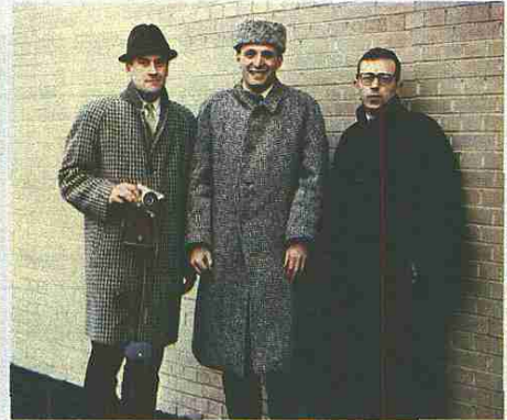
LOS ÚLTIMOS TRABAJOS. El edificio de los Tribunales de Burdeos. La terminal 4 (en unión con el Estudio Lamela) del aeropuerto madrileño de Barajas. Junto a Norman Foster (a la izquierda) y Carl Abott (a la derecha), estudiantes en Yale, en 1962.

glaterra la arquitectura del siglo XIX fue muy floja. Muy poco tecnológica. Los arquitectos de entonces eran peores que los ingenieros. Tal vez por eso, al buscar referentes locales, los arquitectos del siglo XX nos apoyamos en los ingenieros.