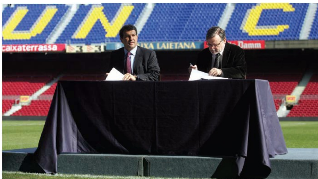
El president Joan Laporta i Jordi Ludevit, degà del Col·legi d'Arquitectes de Catalunya, signant el conveni de col·laboració entre ambdues parts.