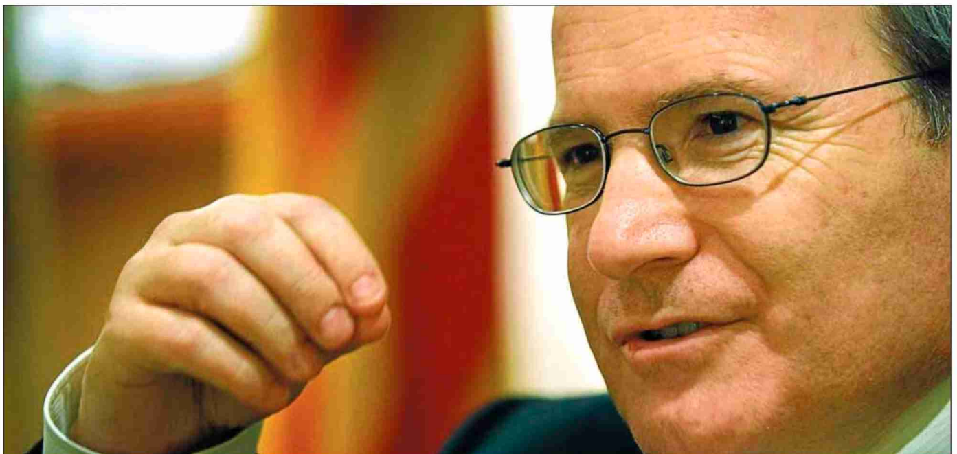
El president de la Generalitat, José Montilla, al seu despatx al Palau de la Generalitat durant l'entrevista amb l'AVUI