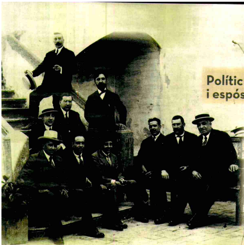
Polític i espós