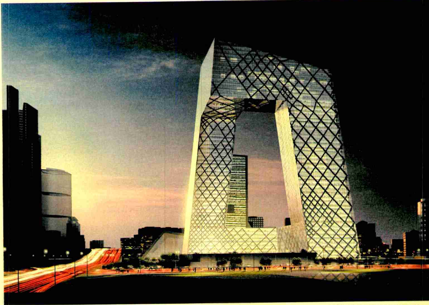
LA CENTRAL DE LA TELEVISIÓN CHINA, EN PEKÍN, SE INAUGURARÁ COINCIDIENDO CON LOS JUEGOS OLÍMPICOS DE 2008 EN LA CAPITAL. TIENE MÁS DE 550.000 METROS CUADRADOS.

OMA/ AMO, es necesaria la combinación de ambos elementos. Nuestro objetivo esencial es basar cada proyecto en las relaciones que se establecen entre la arquitectura y la cultura. Nuevas relaciones que primero se buscan de una forma teórica para poder llevarlas a la práctica después. Además, escribir nos permite crear con mayor independencia. A la hora de construir, hay muchos factores influyentes de los que dependemos. Entre ellos, la necesidad de un trabajo en equipo, las limitaciones económicas o la premura por levantar el edificio. La teoría es un trabajo más lento, pausado y sin obligaciones impuestas. Una libertad necesaria donde nos podemos permitir soñar e idear sin obstáculos.