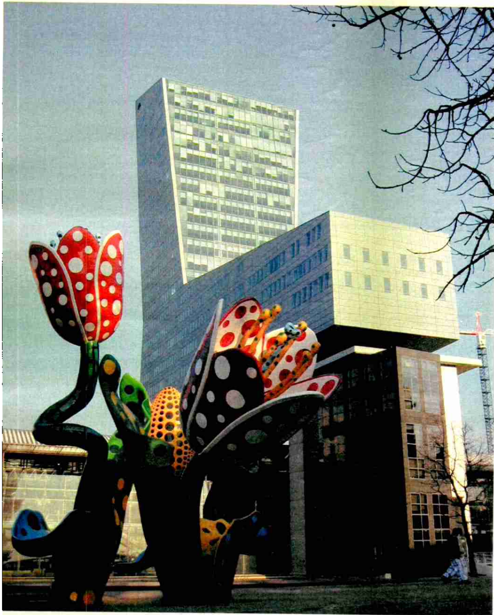
LA TORRE DEL CRÉDIT LYONNAIS FORMA PARTE DEL PROGRAMA URBANÍSTICO QUE KOOLHAAS DISEÑÓ PARA LILLE ENTRE 1989 Y 1995.

hasta la adolescencia. Entonces me trasladé durante unos años a Indonesia. Mis inicios profesionales me llevaron al periodismo y trabajé para un periódico en La Haya. También probé suerte en el cine y escribí algunos guiones. Finalmente decidí trasladarme a Londres donde terminé mis estudios en la Escuela de la Asociación de Arquitectura.