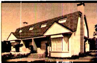
Aspecto de un chal3 situado en Solagua.

otros usos terciarios de car3cter comercial, de servicios y de ocio. Adem3s, el proyecto incluye una gran 3rea comercial de 60.000 metros cuadrados y una zona deportiva aneja, as3 como amplias zonas verdes y espacios libres. El otro complejo de dimensiones considerables que presenta Fadesa es la urbanizaci3n Solagua, que desarrolla en Illescas, a 32 km