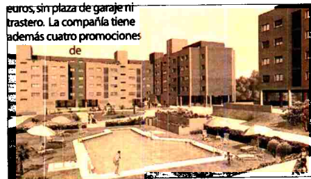
Promoci3n situada en Valdemoro.

vivienda de alquiler, tres de ellas de protecci3n p3blica. Durante el a3o 2004 Metrovacesa ha venido reforzando su presencia en proyectos de costa, con inversiones en Asturias, Llanes y Luanco; en Castell3n, con Panor3mica Golf (Vinaroz) y Playa Almenara; en Valencia, en Playa Puzol; en Alicante, en Playa San Juan, Benidorm y Torreveja; en Almer3a; en Playa Serena (Roquetas de Mar) con nuevas etapas; en la Costa del Sol, Mar3niva y nuevas etapas a la venta en la Marina de Sotogrande; y en Andaluc3a en Chidana (C3dziz).