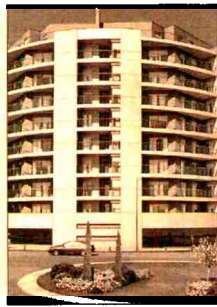
Jardines del Planetario.

En Los Altos de Aravaca, en la misma localidad, el comprador podrá optar por comprar un bajo con jardín o una vivienda de dos dormitorios, por 356.000 euros, a los áticos dúplex desde 789.000 euros. Nozar también trae una promoción en Méndez Álvaro, con precios desde 265.000