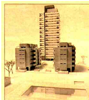
Residencial Puerta de Chamartín, el producto estrella de la división inmobiliaria.

El área inmobiliaria de Ferrovial Inmobiliaria de Madrid, principalmente, sus promociones en la Comunidad de Madrid y las que desarrolla en algunas localidades de costa como Torre del Mar (Málaga); Altea (Alicante) y Las Palmas de Gran Canaria. Son 22 promociones en Madrid (un total de 19) y localidades de costa, con un total de 1.800 viviendas. Las promociones en Madrid se sitúan en Chamartín y Puerta de Hierro, Sanchinarro, Nudo Eisenhower, Pacífico, Vallecas, Campamento, Pau de Carabanchel, Villaverde y los municipios madrileños de Alcalá de Henares, Alcorcón, Boadilla y Leganés. La oferta inmobiliaria de Ferrovial incluirá 6 nuevas promociones con un total de