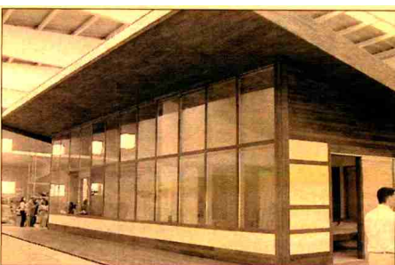
La casa sostenible que patrocina Grupo Pinar.

y Residencial Ávila Pinar. Son 1.619 viviendas situadas tanto en Madrid, como en León y Ávila, que supondrán para la inmobiliaria un desembolso de más de 260 millones de euros en inversión. En el apartado de costa, Grupo Pinar presenta los siguientes residenciales: Residencial Don Miguel; Residencial Añoreta; Residencial Soto Serena; Residencial Vista África; Pinar Jalón; Torre Pinar (Benidorm); Cala Pinar (Campello -Alicante) y Pinar Golf Ibiza. Dentro de Málaga centra las promociones en Marbella, Rincón de la Victoria y Estepona, con más de 600 viviendas a desarrollar. En Levante, la compañía ubica sus desarrollos en Alicante, y en concreto en las localidades de Jalón, Benidorm y El Campello.