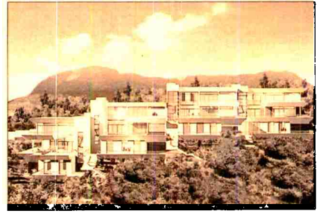
Panorámica de Altea Hills.

La compañía tiene una actividad puntual en el mercado de la vivienda, pero presenta siempre en el Salón promociones singulares. Residencial Altea Hills Views se encuentra situado en la montaña, lo que le permite tener vistas directas al mar, y con las características de estar en la ladera de la sierra. El proyecto tiene una superficie de parcela de 18.000 metros cuadrados y una inversión de 12,5 millones de euros. Cuenta con 22 viviendas unifamiliares en tres alturas, con una superficie construida de 4.751 metros cuadrados, piscina, terrazas y patios, que disfrutarán además de zonas comunes en la urbanización. Las obras comenzaron en el transcurso de 2003, teniendo