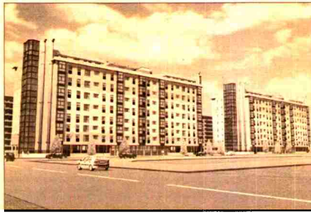
Gran Via, en el PAU de Vallecas.

Una de las novedades que presenta Detinsa es la comercialización de promociones en sus nuevas delegaciones de Valencia y Castilla y León. Así, comienza la venta del residencial Luz de Picassent, en Valencia, que consta de 124 viviendas en altura con garaje, trastero