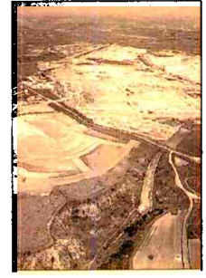
Miramadrid, vista aérea.

un total de 174 viviendas libres en bloque y 131 protegidas a partir de 90 m 2 con distribución de 2,3 y 4 dormitorios, en edificios de tres alturas más ático. El otro macrodesarrollo se sitúa en Villalbilla, en el Corredor del Henares. El Viso de Villalbilla está concebido como una urbanización de baja densidad, donde predominan los chalets unifamiliares, pareados y aislados. Asimismo, dispondrá también de viviendas en bloque abierto. Serán un total de 2.832 viviendas, de las que 700 unidades serán de protección pública. El Viso cuenta con 772 chalets adosados de 190 m 2 construidos en parcelas desde 150 m 2 . Las unidades de chalets pareados serán 848. La promoción también