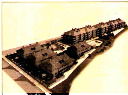
Promoci3n de Dehesa Vieja, de San Sebasti3n de los Reyes.

La compa3a tambi3n se ha situado en nuevos desarrollos y planes parciales, como en Alorc3n y el PAU de Las Tablas. En el plan parcial 12 de Alorc3n vende 120 viviendas desde 201.000 euros hasta 472.000 euros, mientras que en el desarrollo del noroeste de Madrid comercializa producto desde 233.000 euros. Sanchinarro es otro de los desarrollos en los que la