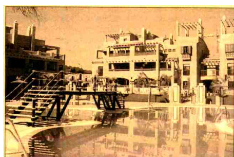
Hacienda del Sol, en Málaga.

El grupo presenta en la actual edición del Salón Inmobiliario de Madrid un total de 21 promociones que suman 2.450 viviendas, ubicadas en la Zona Centro, Málaga, Barcelona, Gerona, Alicante, Las Palmas de Gran Canaria y Sevilla. En la capital española presenta siete promociones en las que se incluyen tanto viviendas en zonas consolidadas, como las 120 viviendas que desarrollará en el distrito de Barajas, como cien pisos en Torrelodones. En el PAU de Montecarmelo, el de Vallecas y Arroyomolinos, tres nuevas zonas de crecimiento, la compañía de FCC y Caja Madrid promoverá casi 500 viviendas en total. Navalcamero es otra de las localidades en las que la empresa construirá un complejo de 108 viviendas. La costa también está en el