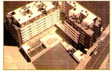
Alameda de Eisenhower, en Madrid.

aliados y proyectos. Este año, la sociedad tiene 40 proyectos en marcha, de los que 25 se realizan conjuntamente con otras compañías, y el resto son promociones de vivienda desarrolladas en solitario e incluso gestiones de terrenos que la nueva sociedad está acometiendo por su cuenta de momento.