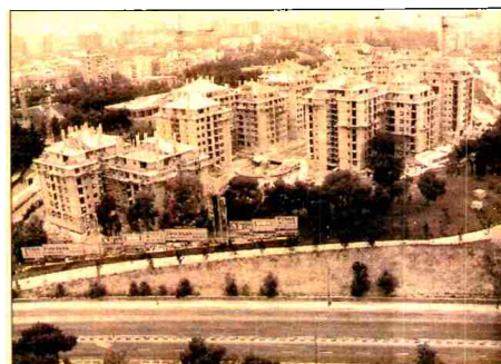
Vista a3rea de los Altos de Arturo Soria.

Urbis ha optado por centralizar toda la oferta que muestra en el Sal3n en vivienda de primera residencia ubicada en la capital espa3ola.