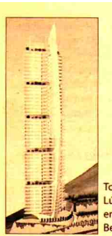
Torre Lúgano, en Benidorm.

De los nuevos proyectos residenciales que la compañía tiene en Madrid destacan el Residencial Azalea de la Villa, que se encuentra en pleno proceso de comercialización y que se ubica en los nuevos desarrollos urbanísticos de Vallecas, junto a la estación de Metro Sierra de Guadalupe. La promoción cuenta con 346 viviendas de 2,3 y 4 dormitorios. Necso Inmobiliaria desarrolla otra promoción en el Ensanche de Vallecas, un proyecto formado por un total de 250 viviendas y unifamiliares cuya comercialización comenzará durante el tercer trimestre del año. La oferta residencial en Madrid que Necso Inmobiliaria presentará se completa con una tercera promoción: Los Vencejos de El Bercial, situada en los nuevos desarrollos urbanísticos