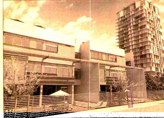
Panorama es un edificio en altura situado en Madrid.

grupo inmobiliario para el producto de costa, dará a conocer a los visitantes los detalles de su primera promoción, 389 viviendas en Estepona, en la cual ha invertido 100 millones de euros. La promoción se comercializará tanto en España como en el extranjero y se construirá en tres fases de 165, 90 y 134 viviendas, respectivamente. La primera se ha iniciado a mediados de mayo, y está previsto que para el otoño de 2005 comiencen a entregarse las primeras llaves. En total, Lar Sol prevé terminar el año con una cartera de 1.200 viviendas en promoción entre la Costa del Sol y Levante, con un valor de 220 millones de euros. Además, explicará el servicio Electa de personalización de la